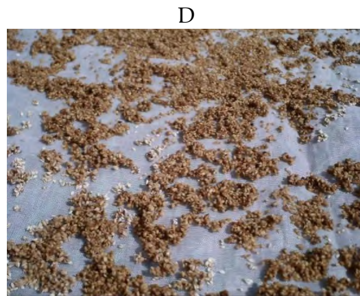
Figura 51.2. A) Fruto recién recolectado, B) en secado, C) en extracción y D) semilla recién extraída y en secado.